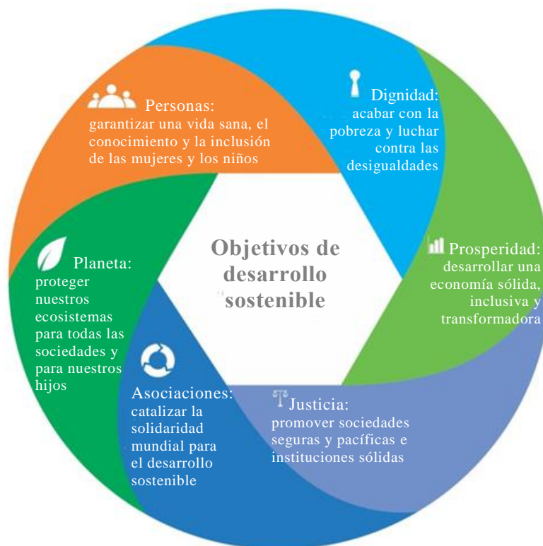
Gráfico I Seis elementos esenciales para el cumplimiento de los objetivos de desarrollo sostenible